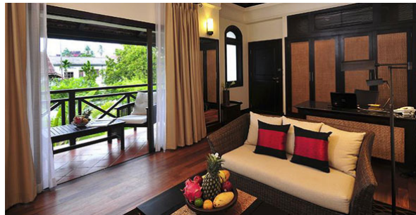
Ansara, Suite Chanthabouly - Vientiane, Laos

Cette section concerne les logements au-dessus de la moyenne avec un niveau de confort et de propreté irréprochable. Ce sont généralement de petits hôtels, idéalement situés avec un certain style basé sur un concept ou un thème qui les différencient des hébergements 5 étoiles. Un design contemporain, une atmosphère délicate, un accueil chaleureux et des services de qualité décrivent bien cette catégorie.