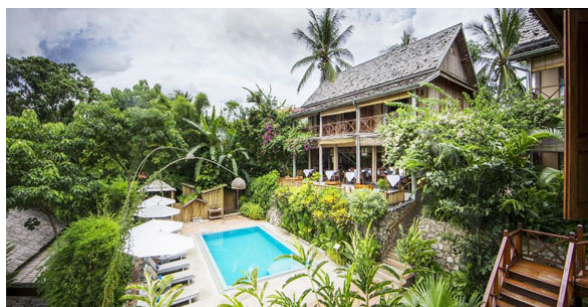
My Dream Resort, Vue extérieure - Luang Prabang, Laos

Ces logements décents sont présents dans les principales villes et stations balnéaires. Sans prétention, ils offrent un excellent rapport qualité-prix.