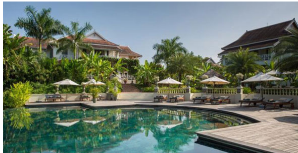
The Luang Say Residence, Piscine - Luang Prabang, Laos

Le seul inconvénient serait évidemment le prix, mais le rêve en a-t-il un ?